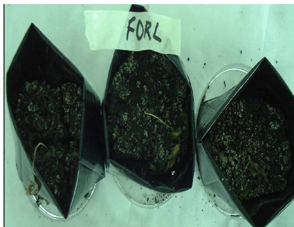
Figure 4 : Flétrissement des plantes de tomate après infection par Fusarium oxysporum f.sp. radicis-lycopercisi

Nos premiers essais de lutte contre les agents de la fusariose par l'utilisation de Pseudomonas fluorescent ont montré que: