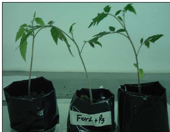
Figure 3: Des plantes de tomate infectées par Fusarium oxysporum f.sp. radicis-lycopercisi et en présence de PfSD13 montrant une protection.

d'intérêt. La poursuite de l'étude sur ces souches est nécessaire pour confirmer d'une part les résultats obtenus et d'autre part étudier leur efficacité potentielle sous différentes conditions du milieu et mettre au clair les mécanisme cellulaires et moléculaires d'interaction Pseudomonas - plante - pathogène impliqués dans la protection.